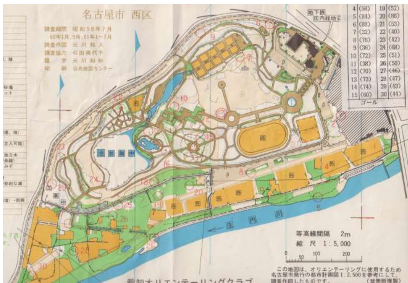
昭和 61 年ごろ(開園当初)の庄内緑地オリエンテーリングマップ(オフセット印刷)