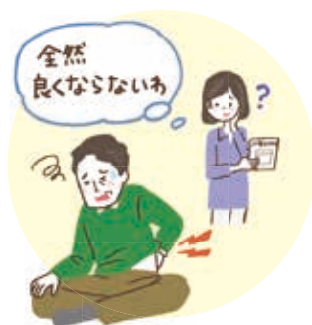
痛みが 長続きしている