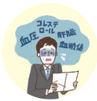
健康診断の結果を 見てもよくわからない