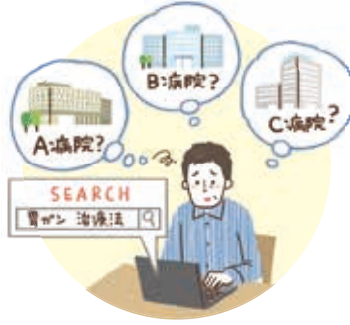
病院選びの 基準がわからない