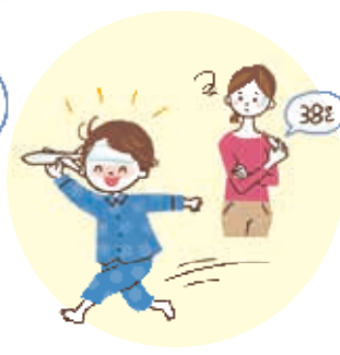
家族の体調が心配