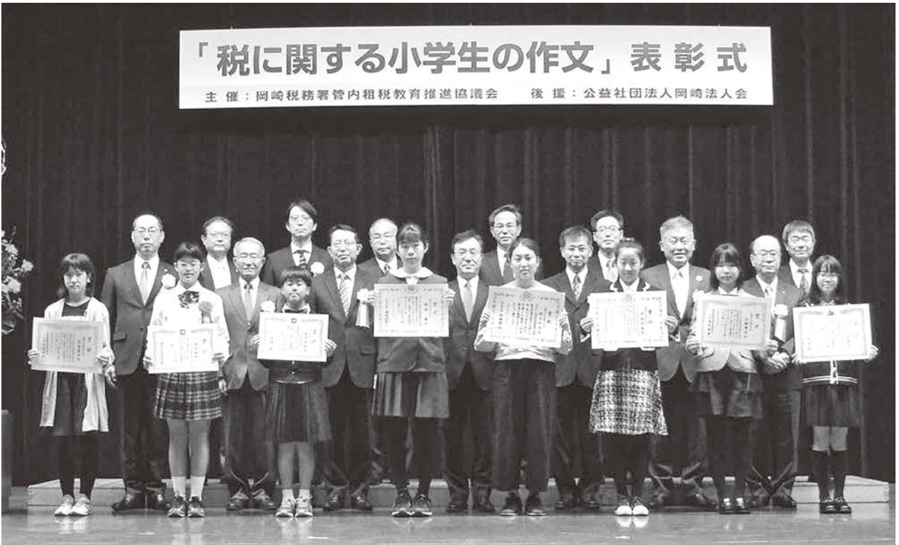
▲受賞者8名のみなさんと関係者

平成30年度の『税に関する小学生の作文』の表彰式が平成31年2月24日（日）岡崎商工会議所大ホールで開かれました。