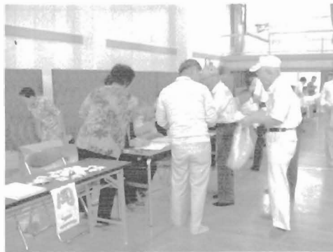
美合小学校児童の姿がない受付風景

式典終了後のアトラクションでは、舞台準備、進行のお手伝いは例年福祉委員会の担当ですが、今年は岡保育園児の歌と児童の吹奏楽合奏やマジックが取りやめとなってしまいました。