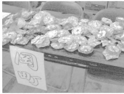
コースターが寂しように机の上に並べられていました