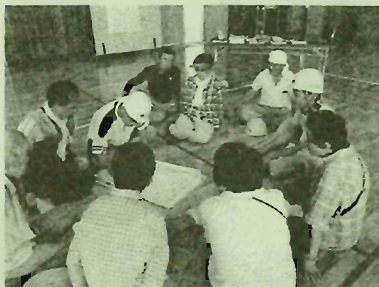
災害時宿泊体 験の様子