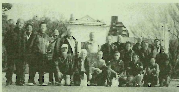
防災センター視察