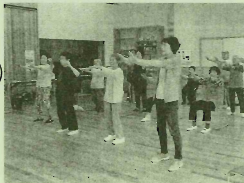
高齢者 いきいきサロン ひだまり