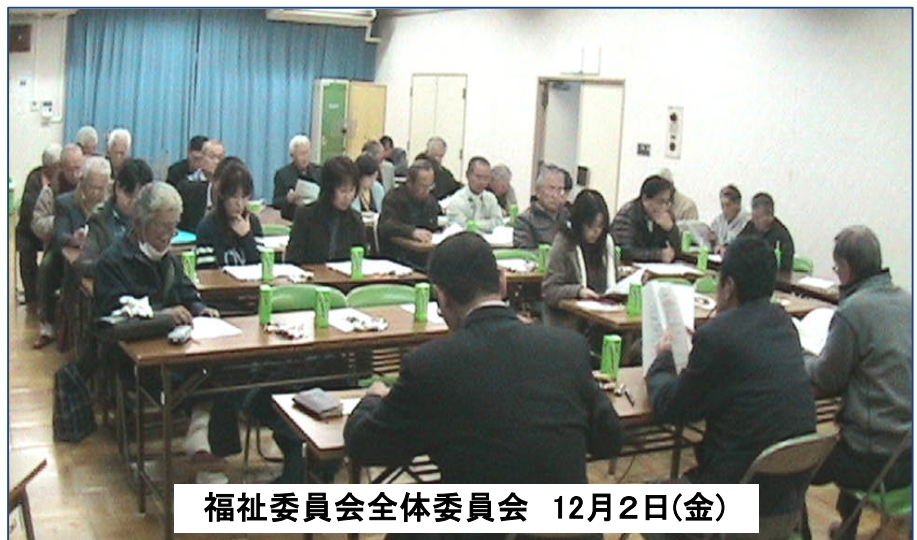
福祉委員会全体委員会 12月2日(金)