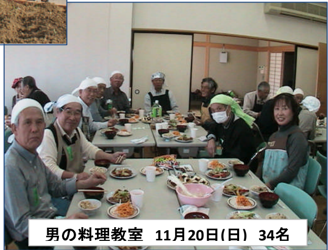
男の料理教室 11月20日(日) 34名

スタミナメニューは、たっぷりの豚肉生姜焼き、あっさり大根サラダ、栄養豊富な炊き込みご飯、赤だし、デザートには小倉ホットケーキ。美味しく出来たよ！