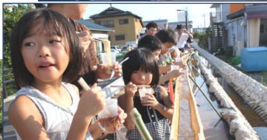
冷たくてなが〜い「そうめん流し」