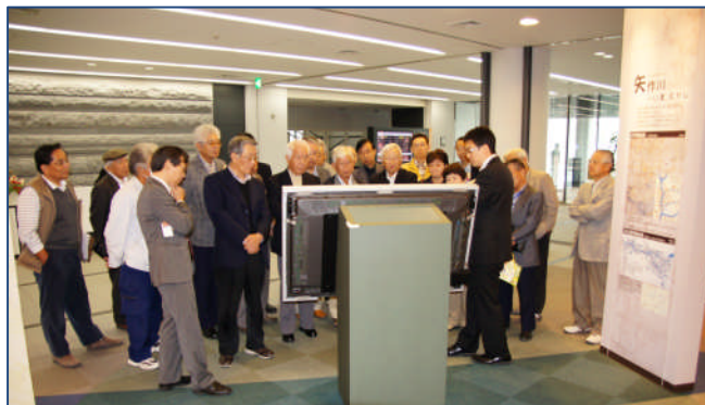
市防災展示コーナー 11月2日(水) 23名

やはぎかんの「地域活動交流会」は、矢作地区5学区と城西高校そして、やはぎかんの7団体が、それぞれ特色のある地域に密着した活動を発表。