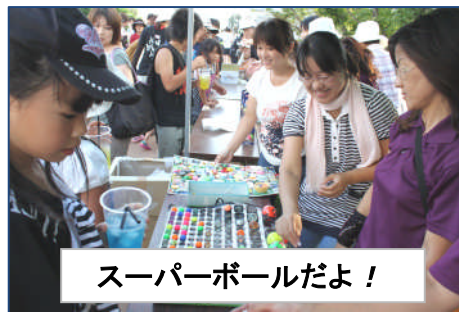
スーパーボールだよ！

学区の総代会が中心となり「長瀬遊歩道」の完成記念イベントが開催されました。全長2000m弱を利用し、各町がさまざまな工夫を凝らした特色のある祭り会場を設営、スタンプラリーも行われ楽しい交流の輪が広がりました。