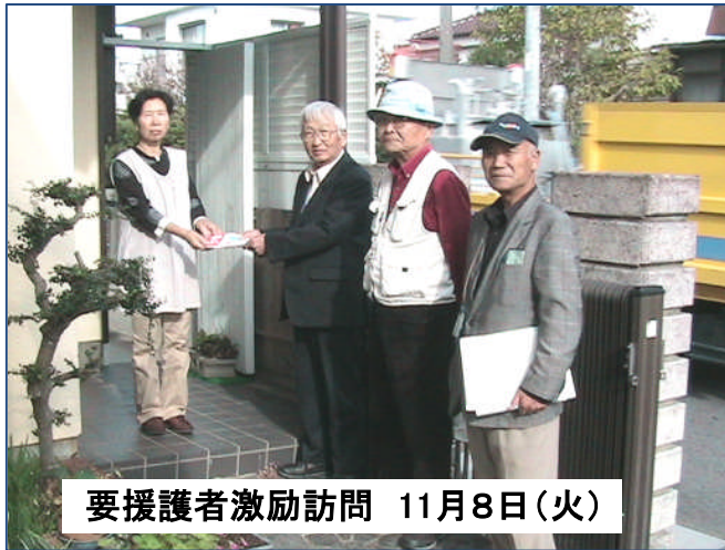
要援護者激励訪問 11月8日(火)