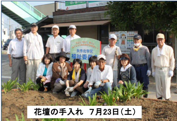
花壇の手入れ 7月23日(土)