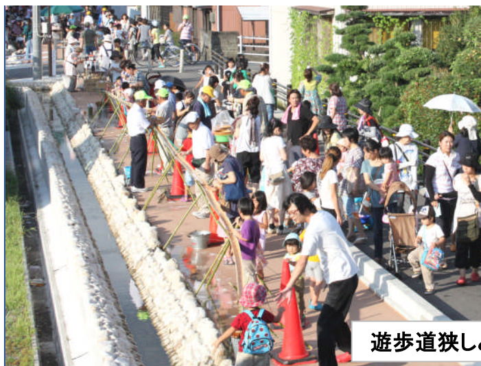
遊歩道狭しと大盛況 8月27日(土)