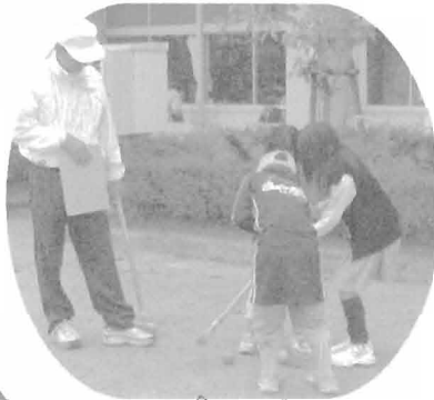
校長先生の特訓中

3世代交流グランドゴルフが11月15日(土)午前9時～山中小学校運動場にて開催されました。当日はあいにくの小雨にもかかわらず、34組(204人)もの大勢の参加でした。初めてのメンバーにもかかわらず、えがおいっぱいでき、ふれあいがより深まりました。