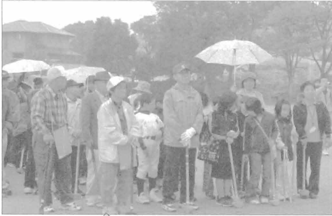
小雨の中で開会式

3世代交流グランドゴルフが11月15日(土)午前9時～山中小学校運動場にて開催されました。当日はあいにくの小雨にもかかわらず、34組(204人)もの大勢の参加でした。初めてのメンバーにもかかわらず、えがおいっぱいでき、ふれあいがより深まりました。