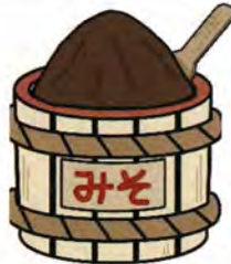
長い時間をかけて 熟成させる味噌