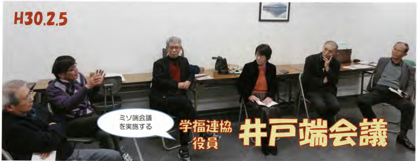
ミソ端会議 を実施する