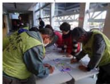
ボランティア役 体験中

岡崎市で大規模災害が起きたら、災害ボランティア支援センターが設置されます。全国から来るボランティアはこのセンターを経由して被災者のお宅での活動に出かけます。センターではどのような手続きが行われているのを知り、地域が安心してボランティアを受け入れられる準備をしていたくための体験会を行います。