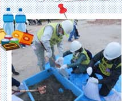
土のう作り 体験中

皆さんにはボランティア役になっていただいて、実際の災害ボランティア支援センターの流れを体験していただきます。 ※当日はボランティア活動をするわけではありません。