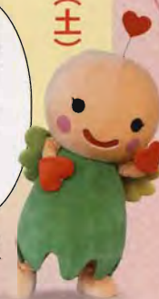
岡崎市社会福祉協議会 マスコットキャラクター はぴりん

ボランティア団体や福祉施設による福祉体験、模擬店、授産施設の製品販売などを実施します。