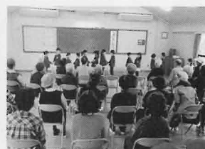
いきいきクラブでの交流(稲熊保育園)

「<ご存知ですか?>」みなさんのお住まいの学区の福祉委員会活動はホームページでも見ることができます。 http://home1.catvmics.ne.jp/~okashavc/ から 学区福祉委員会(外部リンク) へアクセスして下さい。