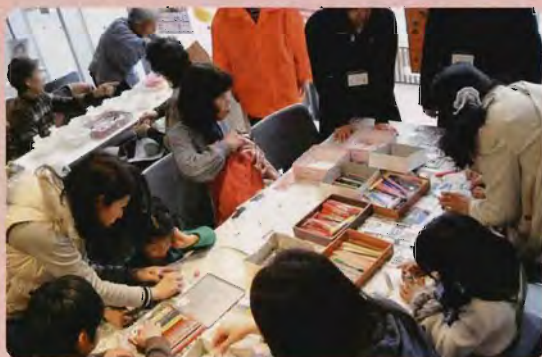
平成二十六年年度の様子