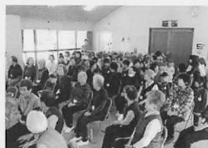
いきいきクラブでの交流(梅園幼稚園)