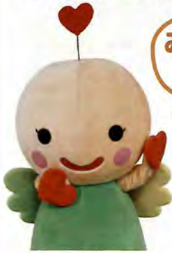
岡崎市社会福祉協議会 マスコットキャラクター はぴりん

発見がいっぱいの福祉体験や楽しいイベント、 おいしい食べ物も盛りだくさん。 素敵なゲストも登場します。お楽しみに!