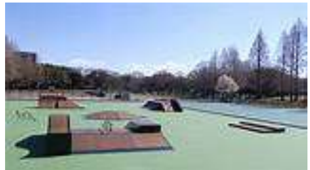
庄内緑地公園スケートパーク

たり、練習ができたりする施設もできている。名古屋市北部にある庄内緑地公園である。以前はオリエンテーリング大会も開催されたこともある緑豊かな遊水地帯を活用した公園である